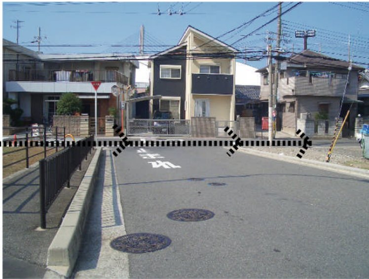
新橋の方から撮影、「見通しの悪さ」が解消された (改良工事はこれからです)