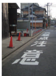
地車小屋の前に「交差点注意」の標示新設