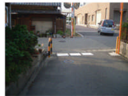
奥野散髪屋横、府道に面して「停止線」新設

昨年9月 嘉祥寺地域の交通安全総点検(ヒヤリマップの作成)以後、上記箇所以外に対策が実施された箇所と内容