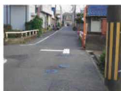
「カラオケたえ」手前の三叉路に標示を引き直し