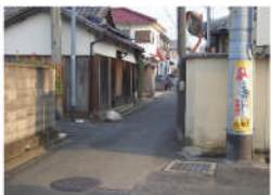
嘉祥寺地域内の電柱に「子ども飛び出し注意」の腹巻き新設