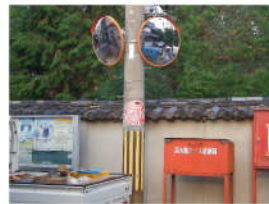
嘉祥神社正面の電柱に左右カーブミラー新設