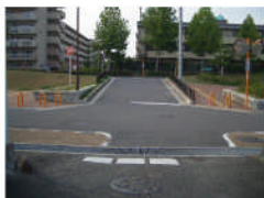
りんくう地区前道路に面して「停止線」新設