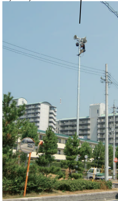
嘉祥寺地区から撮影